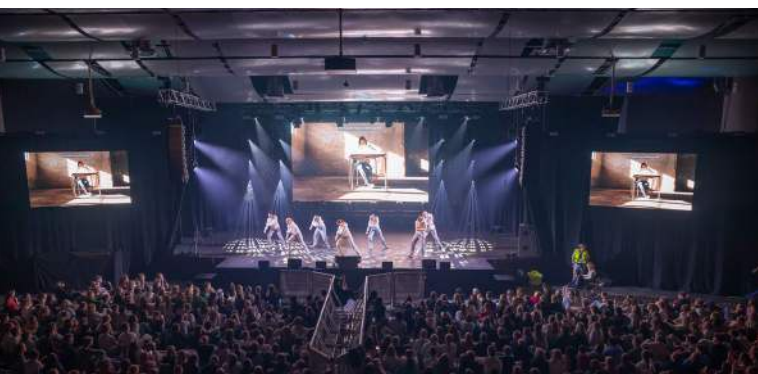
«Vingspenn ble framført for 2000 oppmerksomme ungdommer på festivalen Impuls Stavanger i januar.»

Det er fristende å gi etter for avmaktfølelsen eller trekke oppgitt på skuldrene. Men siste avsnitt i nevnte prekenrefleksjon ga oss «bunnplanken» for arbeidet i 2024 og for videre innsats: «... Tro og gjerning hører sammen. Vi er bærere av et oppdrag – i møte alle mennesker, spesielt de marginaliserte og de som blir utnyttet og plaget ... Jesus utfordrer oss til å ta bena fatt, åpne våre hjerter og strekke ut våre hender til mennesker i vår tid. Så lenge det er dag, må vi gjøre hans gjerninger som har sendt oss.»