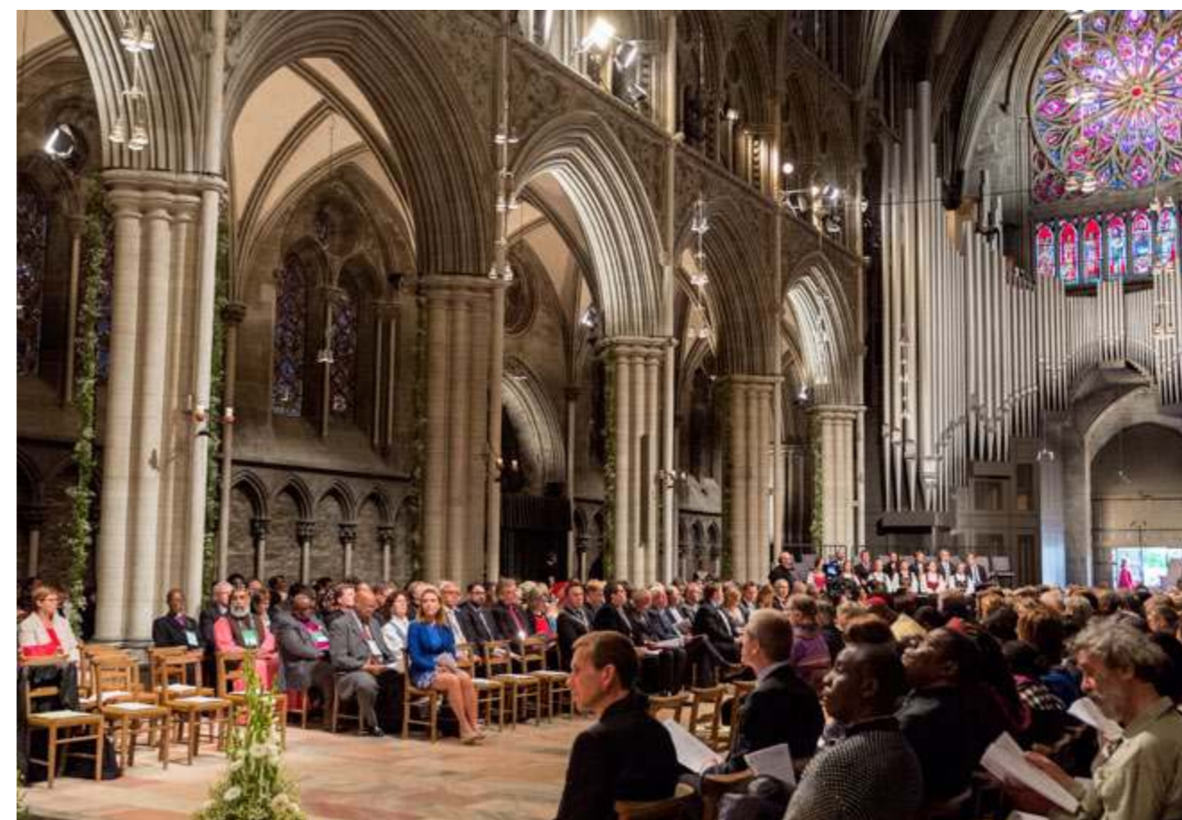
Fra åpningsgudstjenesten på Kirkenes Verdensråds Sentralkomitemøte i Trondheim, juni 2016. En rekke norske kirkeledere deltok sammen med delegater fra sentralkomiteen, frivillige og representanter fra det offisielle Norge samt kongehuset.

NKR var også medvertskap for Kirkenes Verdensråds sentralkomitemøte som ble avholdt i Trondheim i juni. Mange av kirkelederne var med på deler av dette møtet, noe som gav en nyttig kjennskap til den internasjonale økumeniske bevegelsen.