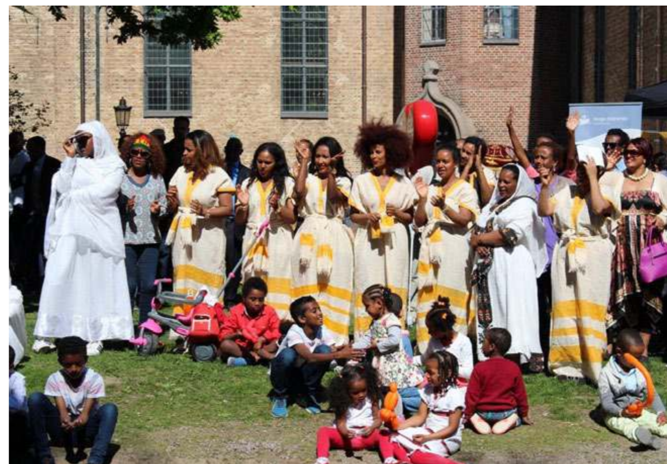
Flerkulturell Pinsefestival på Domkirkeplassen i Oslo.

Flerkulturelt kirkelig nettverk i NKR i samarbeid med KIA og Oslo Bispedømme i Den norske