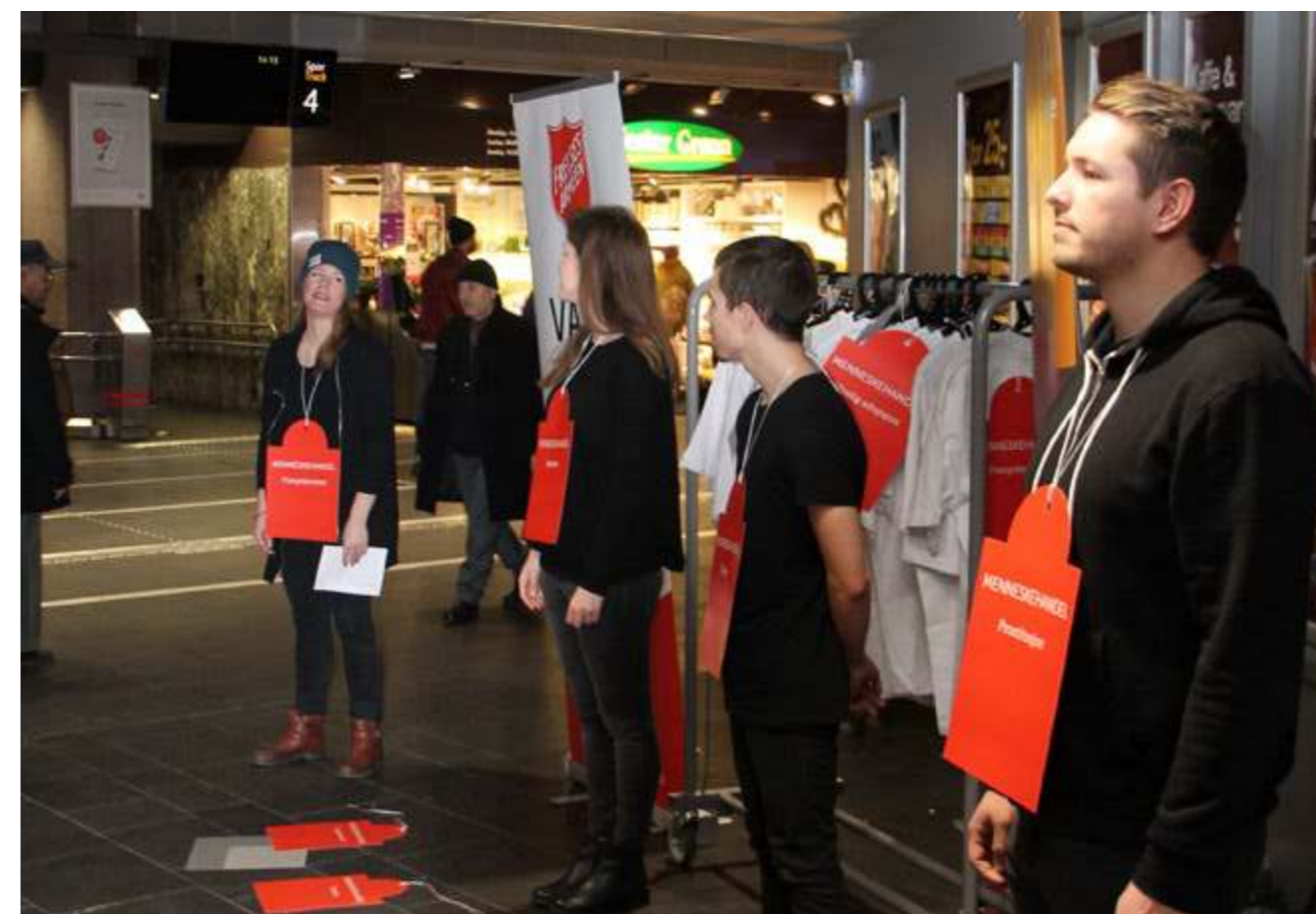
Norges Kristne Råd og Frelsesarmeen makerte Global uke med et stunt op Oslo Sentralstasjon, der personer stod oppstilt med store prislapper om halsen. 500 flyers med info om moderne slaveri ble utdelt på 30 min.