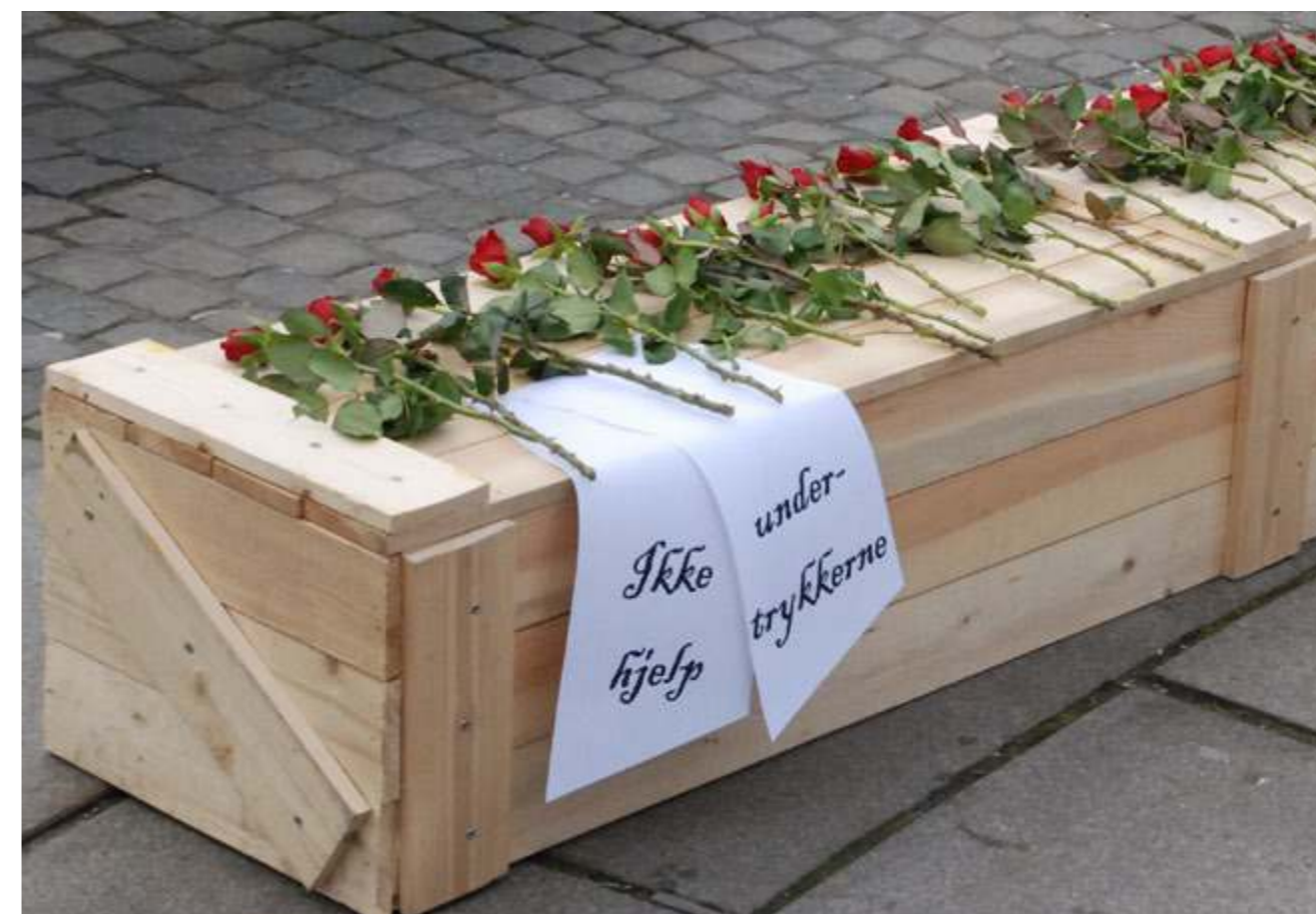
Minnemarkering for ofrene for tortur og dødsstraff i land som Norge eksporterer militært utstyr til.