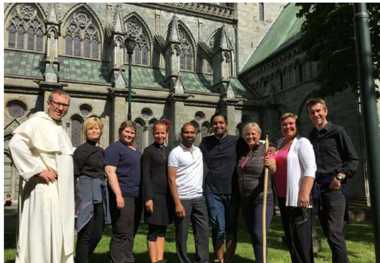
Interreligiøs pilegrimsvandring til Trondheim i regi av Kulturdepartementet.

RPU har også blitt holdt løpende orientert om status i arbeidet med å etablere Dnk som et selvstendig rettssubjekt fra 1.1.2017.