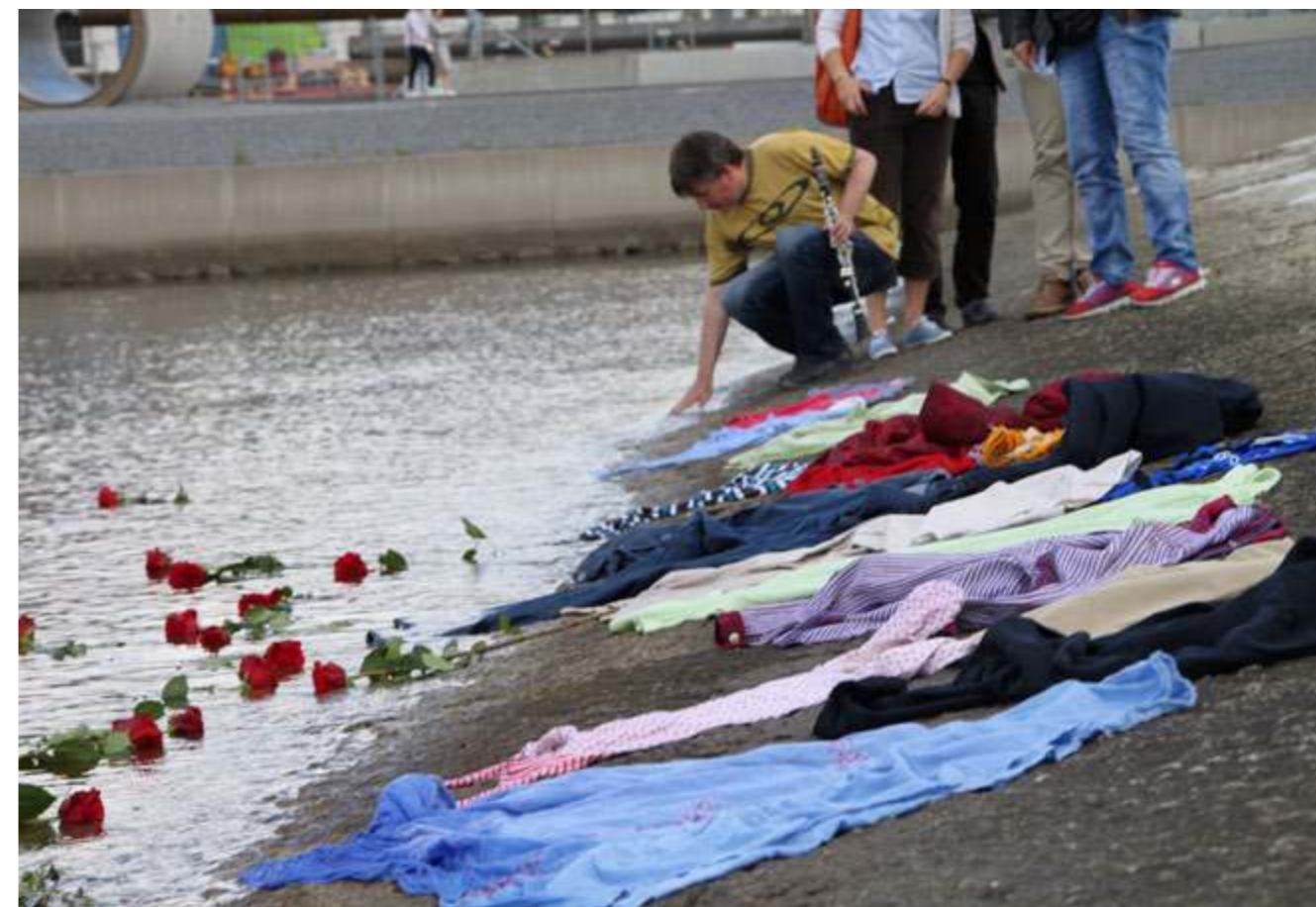
Deltakere legger roser i vannet under markeringen på Operataket i juni 2015.